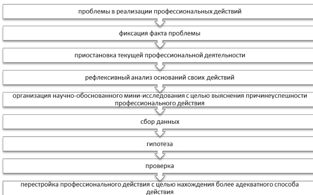
Схема 2. Цикл развития профессиональных действий

Педагог, реализующий обучение по типу учебной деятельности, направленной на формирование способности учащихся к самостоятельному обучению, неизбежно оказывается таким же обучающимся, как и его учащиеся. То есть, в развивающем обучении развивается вся система деятельности, включая не только учащихся, но и учителя, в то время, как в традиционной (знаниевой) модели обучения не развивается никто (ни учащиеся, ни учитель).